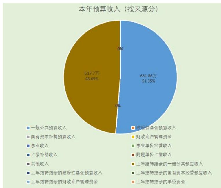
图 1. 收入预算图

本年事业单位经营收入 0 万元，占 0%； 本年上级补助收入 0 万元，占 0%； 本年附属单位上缴收入 0 万元，占 0%； 本年其他收入 0 万元，占 0%； 上年结转结余的一般公共预算收入 617.7 万元，占 48.65%； 上年结转结余的政府性基金预算收入 0 万元，占 0%； 上年结转结余的国有资本经营预算收入 0 万元，占 0%； 上年结转结余的财政专户管理资金 0 万元，占 0%； 上年结转结余的单位资金 0 万元，占 0%。