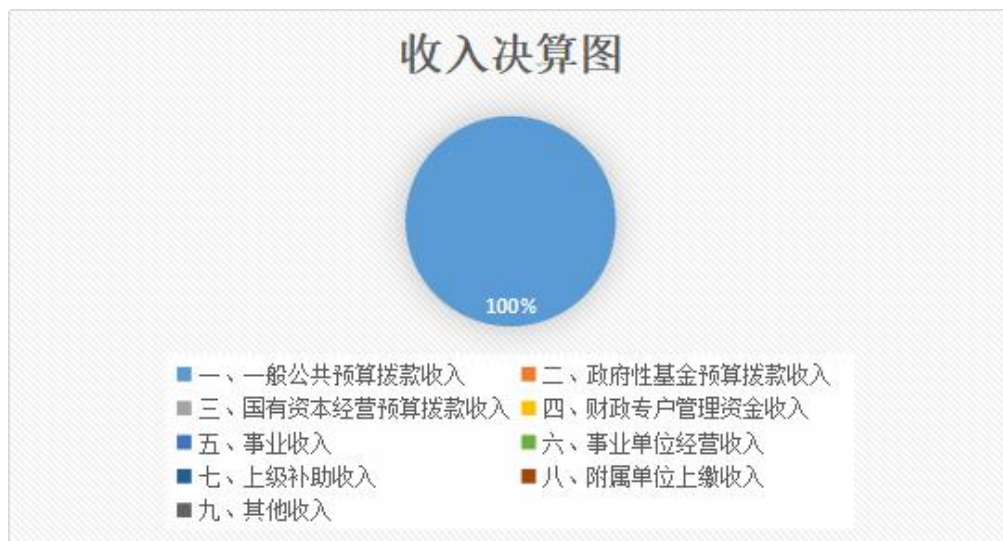
图 1. 收入预算图

上年结转结余的财政专户管理资金 0.00 万元，占 0.00 %； 上年结转结余的单位资金 0.00 万元，占 0.00 %；