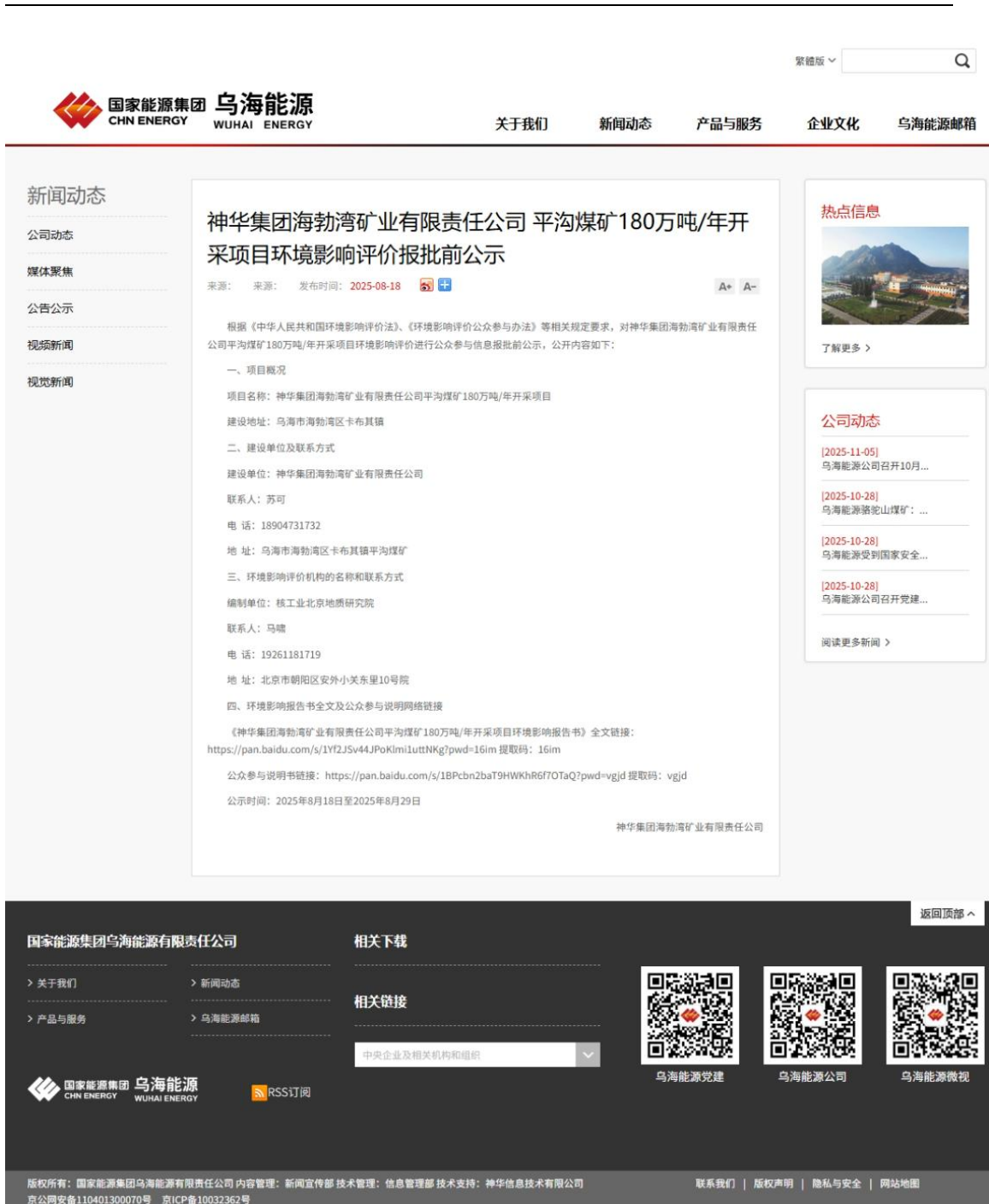
图 6 报批前公示截图