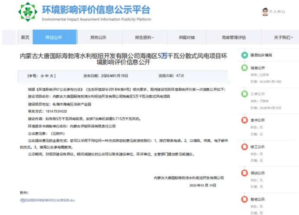
图2-1 项目一次公示情况